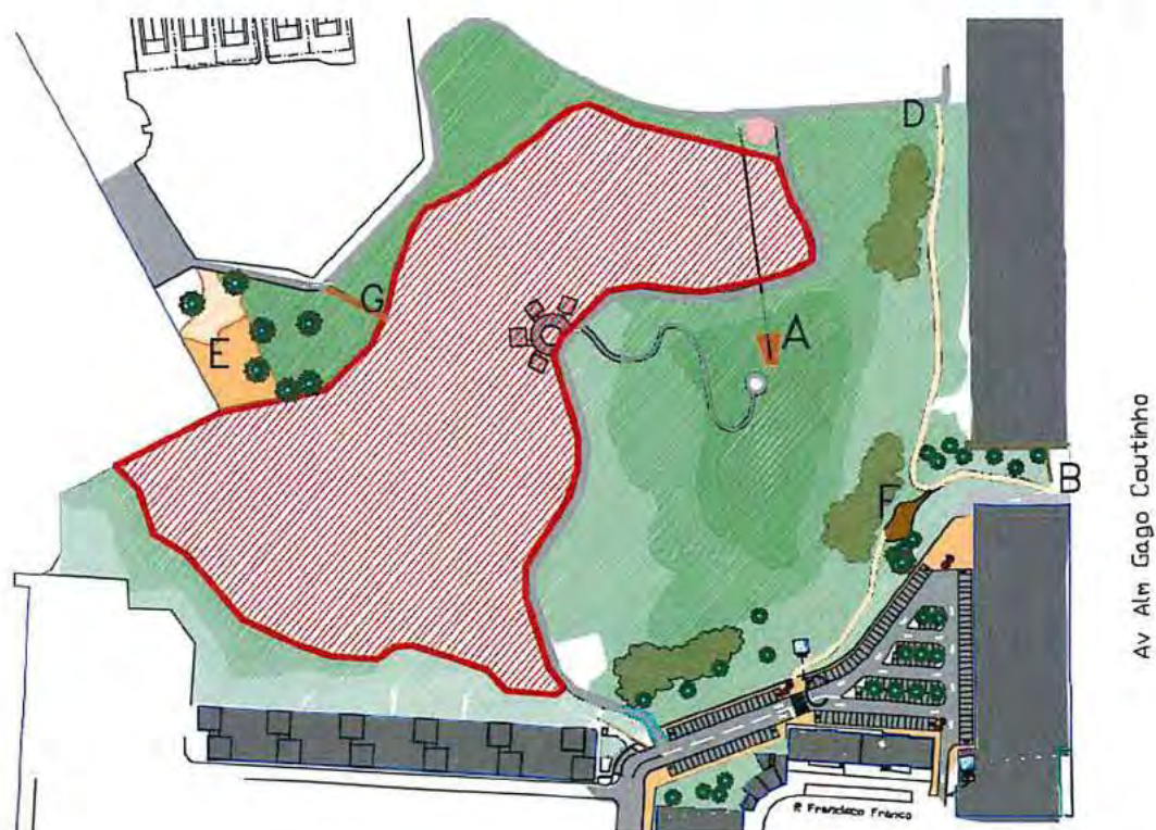
Fig.3- Plano Geral.

Esta intervenção insere-se no projeto de manutenção qualificada do Parque José Gomes Ferreira/Quinta do Narigão, e que para além da intervenção em apreço inclui também a criação de novas zonas de estadia e lazer, percursos pedonais alternativos e um novo parque de estacionamento com pavimento permeável e com espaços verdes integrados (ver figura 3).